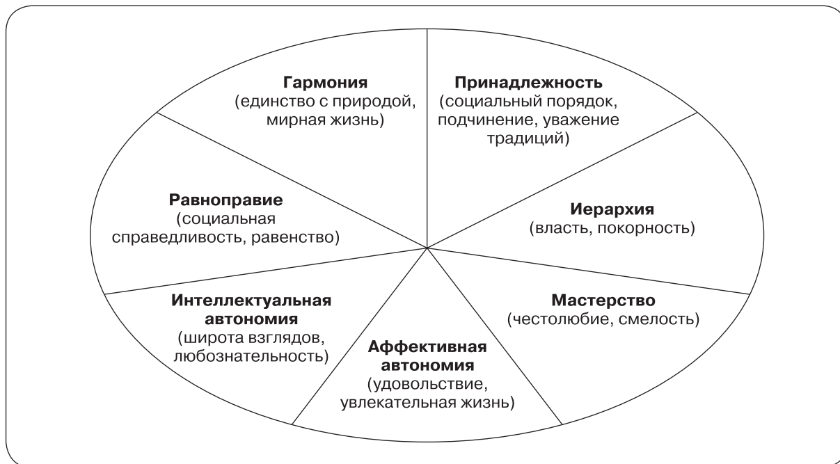
Рис. 1. Теоретическая структура культурных ценностных ориентаций Ш. Шварца

автономия означает развитие индивидами собственных идей, творческих способностей и интеллектуальное развитие, основанное на ценностях любознательности, творчества и широты взглядов [Schwartz, 1994]. Вместе с тем в культурах с ориентацией на принадлежность индивиды рассматриваются как часть коллектива, группы. Социальные отношения, идентификация с группой, уважение традиций, подчинение, безопасность семьи и стремление к общим целям — ключевые ценности в таких культурах [Schwartz, 2006].